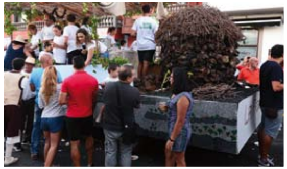
Barrio de La Fajana