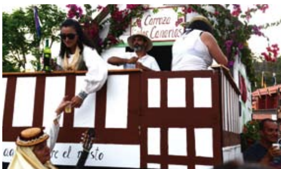
Barrio de Los Canarios