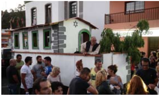
Barrio de El Charco