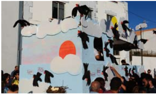
Barrio de Las Caletas