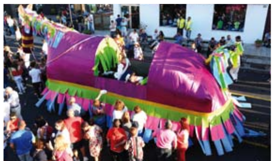
Barrio de Los Quemados