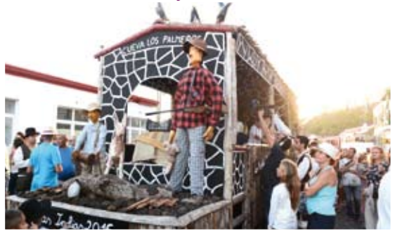
Barrio de Las Indias